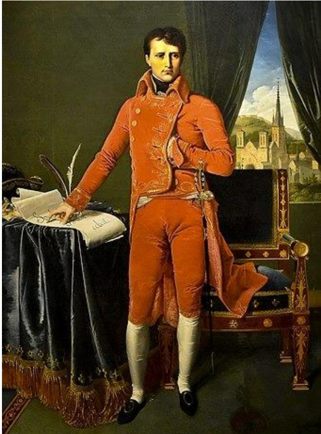
Napoleão 1º Cônsul