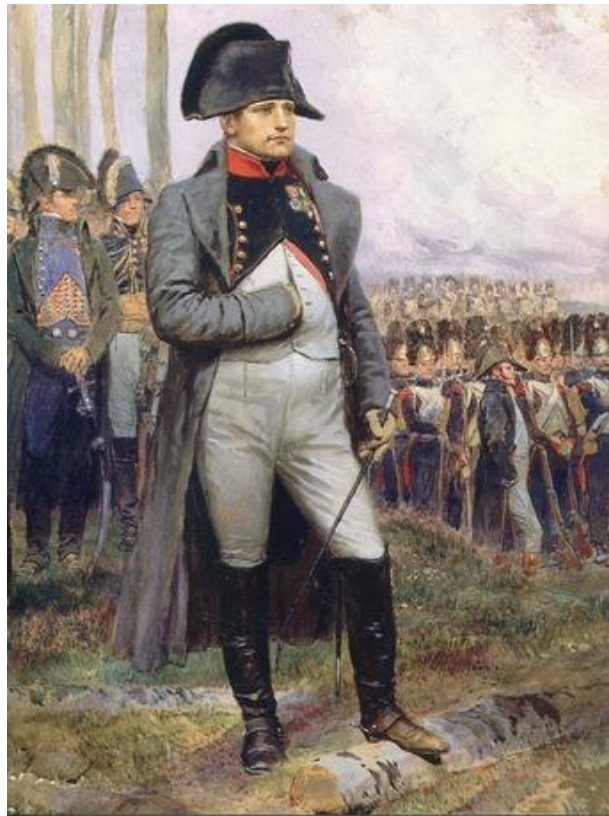
Napoleão e seu exército