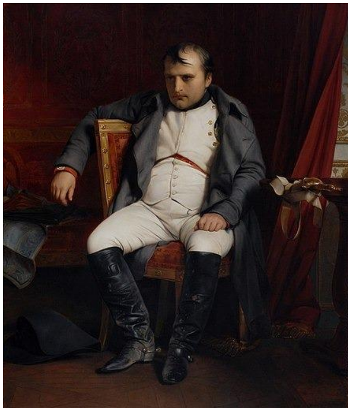
Napoleão em seus últimos anos