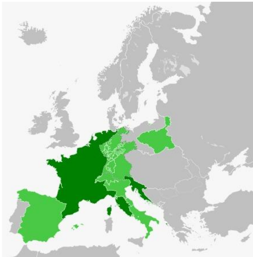
Império Francês em seu ápice na Europa