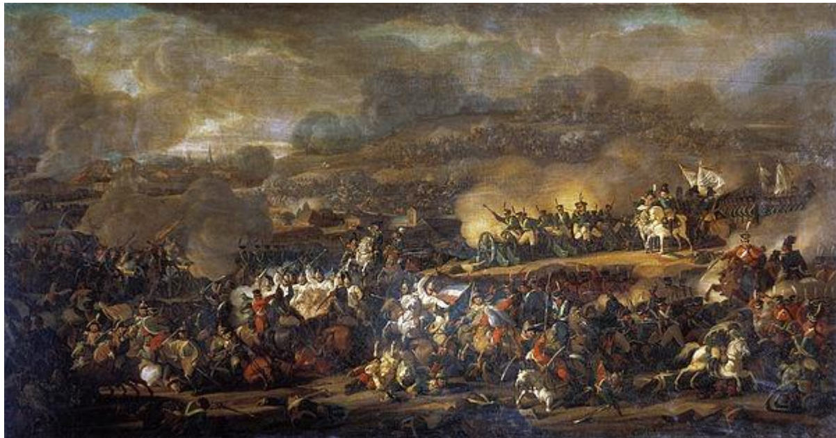
Batalha de Leipzig