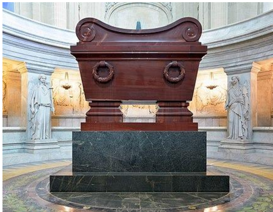
Tumba de Napoleão no Les Invalides