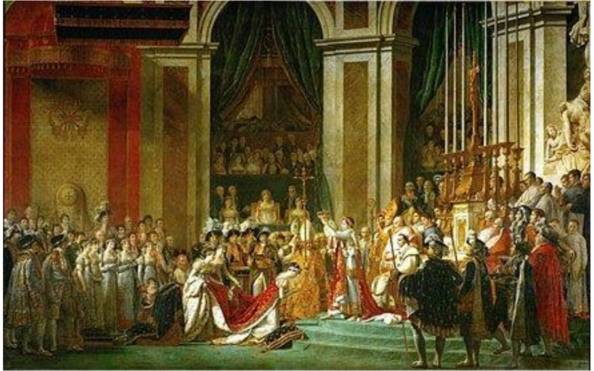
Napoleão se coroado